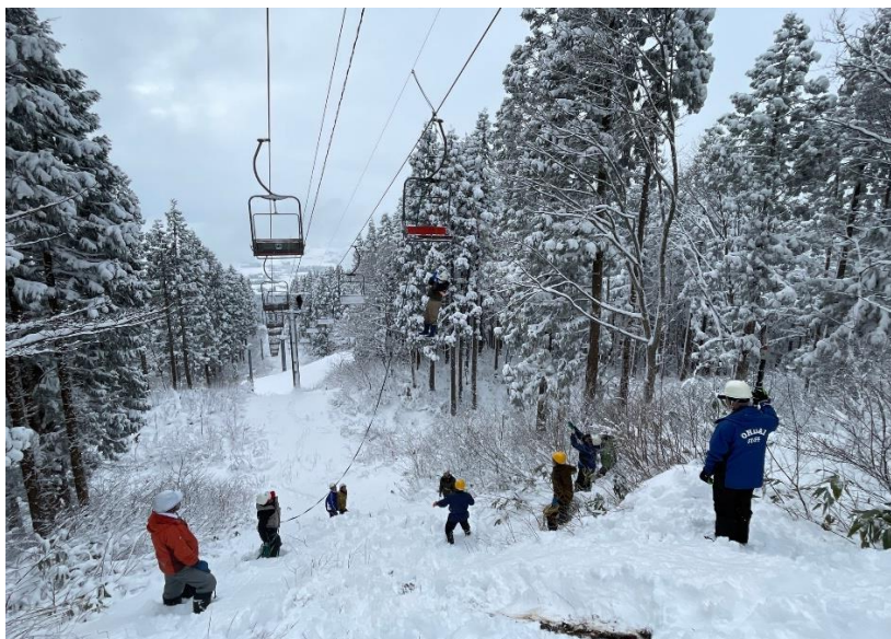
救助ポールを使えないため補助ワイヤーを使つての救助訓練