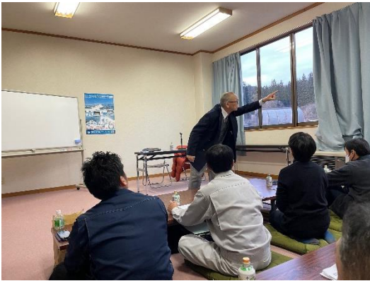
秋田県労働基準協会講習会 (12月15日)