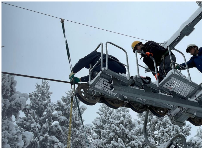
補助ワイヤーを使つての救助訓練